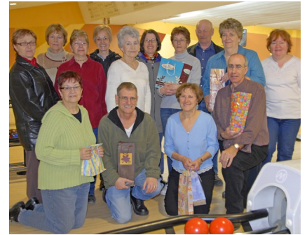
Le groupe des gagnants