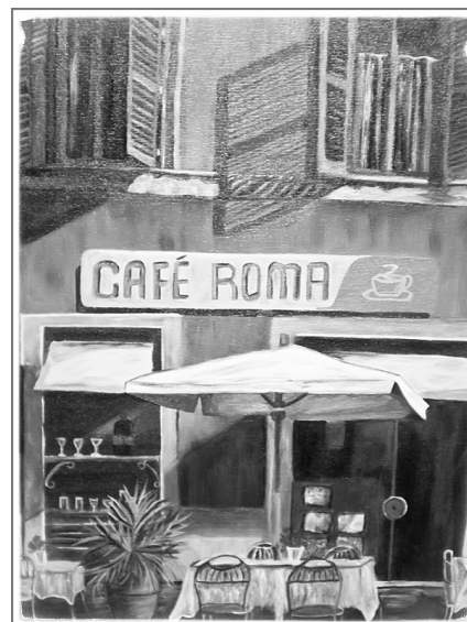
2 e prix : Mon café préféré Michèle Bisson