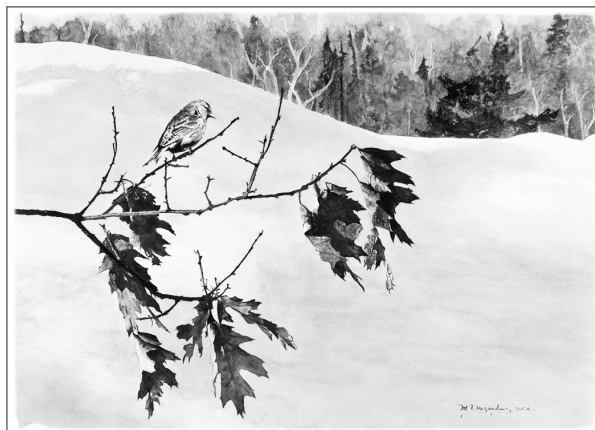
2 e prix : J'ai planté un arbre Monique Desjardins