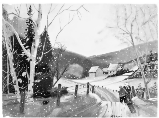
1 er prix : Retour à la maison Michèle Bisson