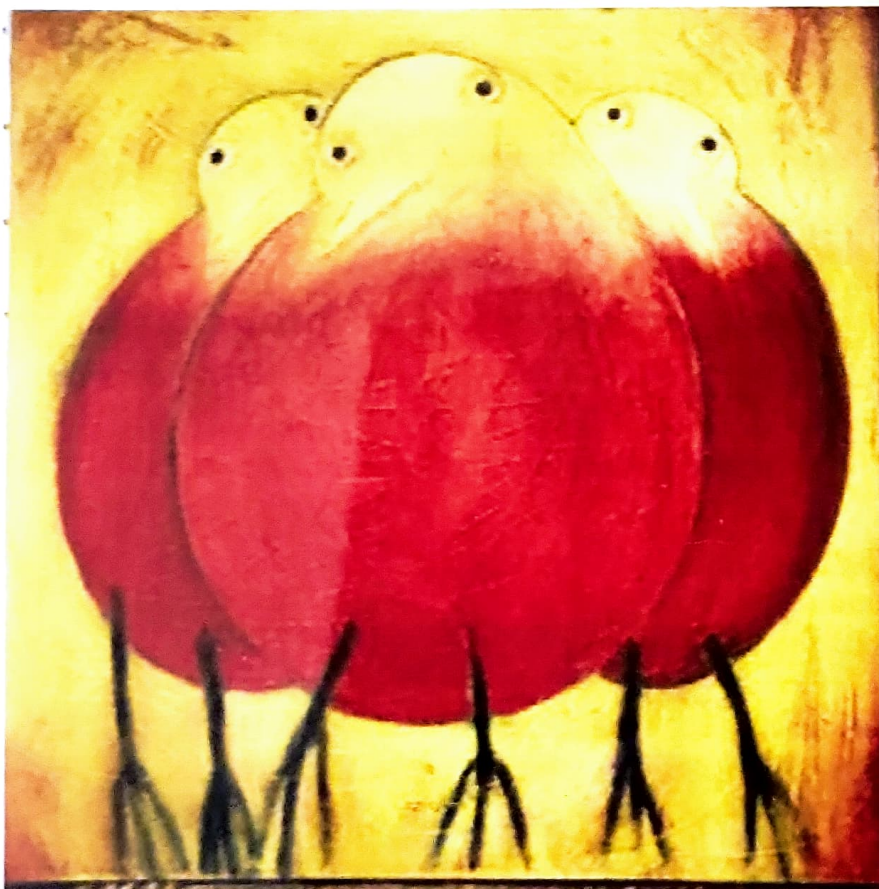
Peinture : Thérèse Joannette