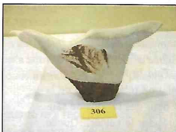
L'oiseau, bois d'original Pierre-Paul Renaud