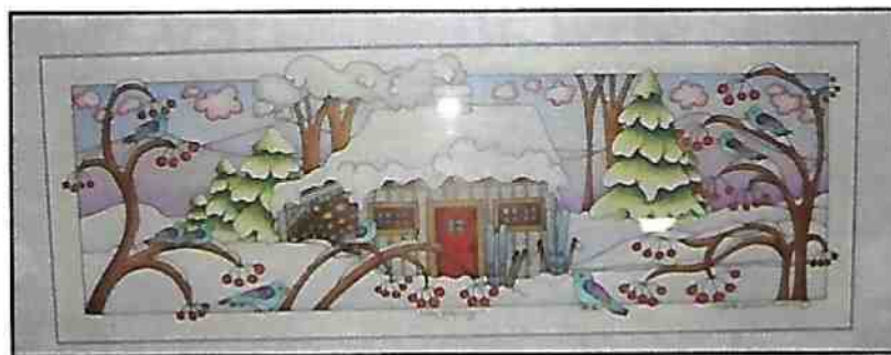
Le refuge , dessin aux crayons de couleur Lyette Rousille