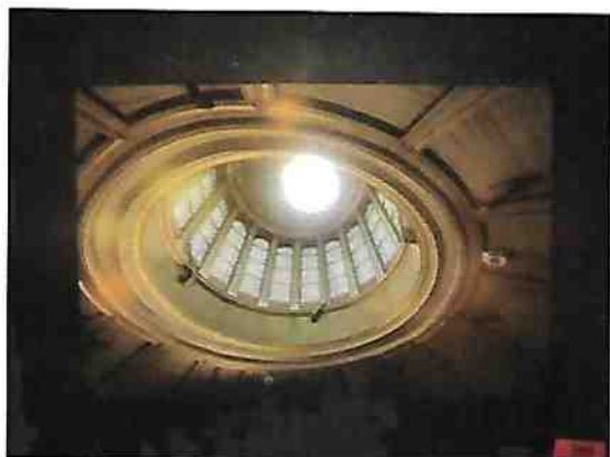
Voyage dans l'espace Photographie de Jeannine Pitre

Voici un aperçu des autres formes d'art présentées à l'Assemblée générale sectorielle. Elles illustrent bien la diversité qui les caractérise. Comme l'exprime si bien Constantin Brancusi, « La simplicité est la complexité résolue. » En terminant, je remercie tous les artistes pour le rôle si important qu'ils jouent à cette rencontre.