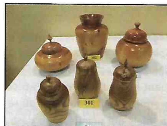
Pots décoratifs en bois de vinaigrier et de pommier Roger Chamberland