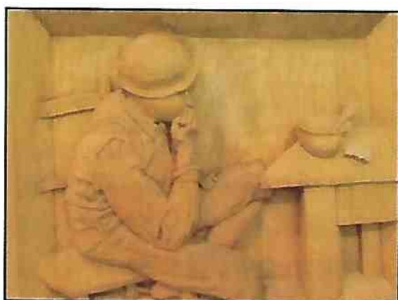
L'enfant, inspiré d'Ozias Leduc Pierre-Paul Renaud