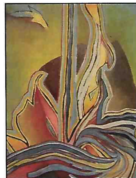
Réversible , acrylique Marcel Charest