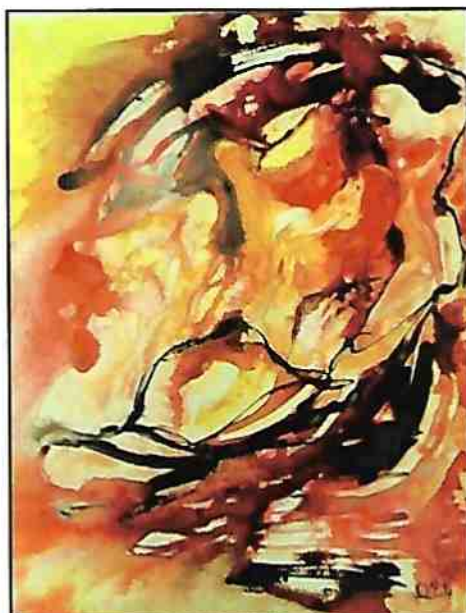
Tourbillon amoureux , aquarelle Nicole Proulx