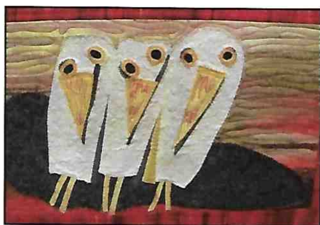
Les trois amis, d'après un tableau de Thérèse Joannette Vona Rooney