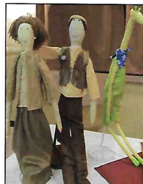
Poupées Nadine Ruelle