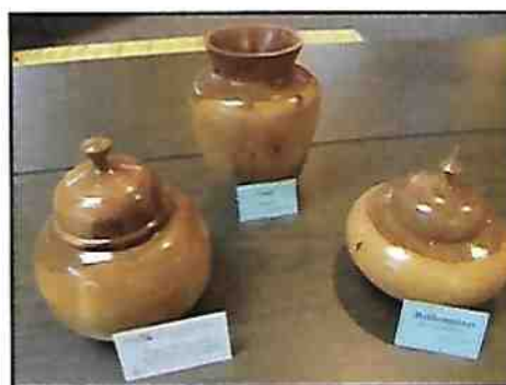
Trois pots décoratifs en bois de pommier Roger Chamberland