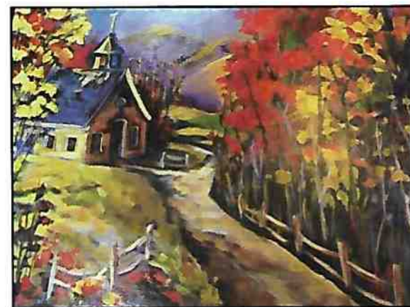
Au revoir Robert , huile/acrylique Thérèse Piet