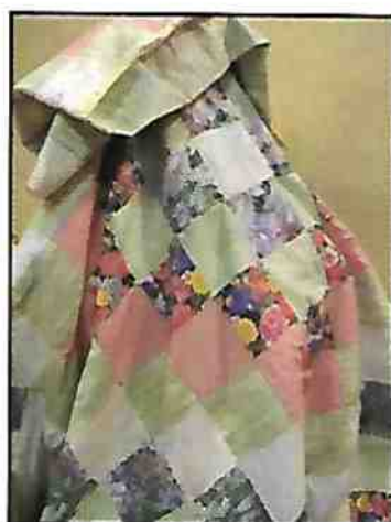
Courtepointe Lucile Clin Kombul