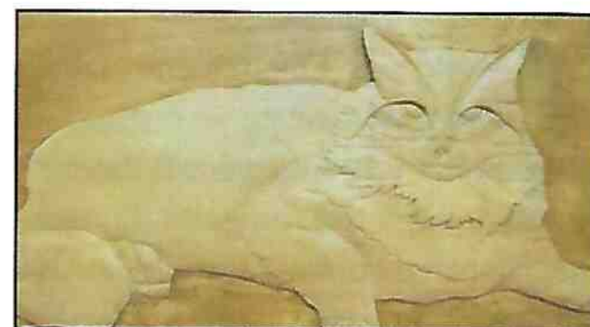
Raminagrobis, haut relief Yvan Landry