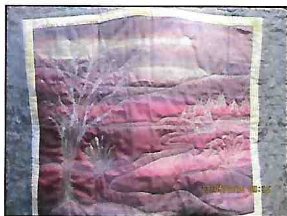
Nuit de janvier, Mixte media