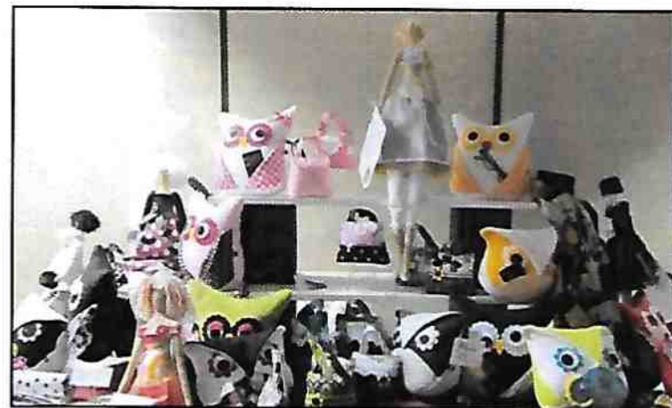
Poupées, napperons, coussins et mini sacoques