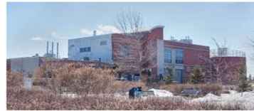
Usine de filtration des eaux