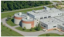
Usine d'épuration des eaux usées